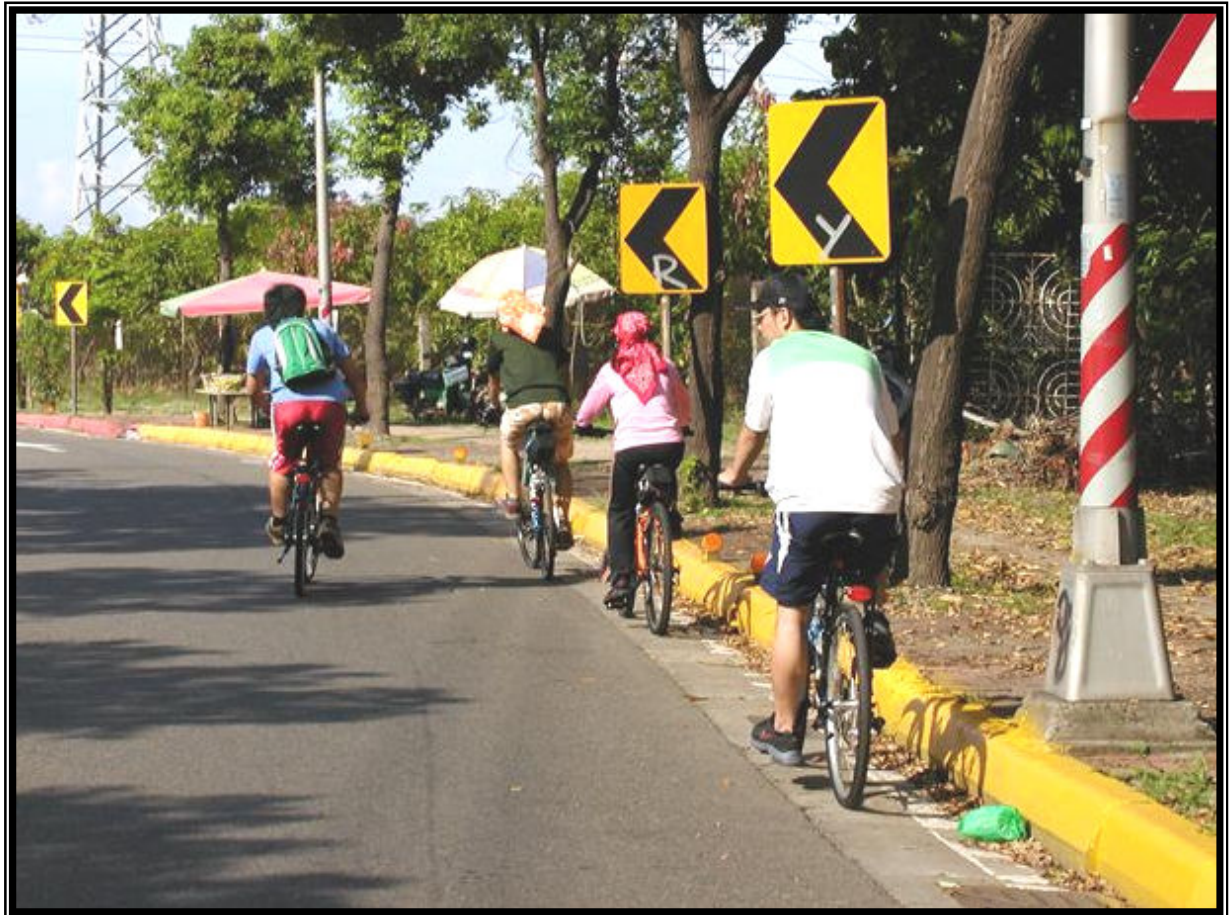
↑ 6/02 第一次騎長程，於屏東佳冬鄉附近折返，共騎 92 公里。

6 月 02 日第一次騎長程，目的地是墾丁，然後搭車回高雄，但是為了省車錢，騎到一半便折返，共騎九十二公里，共約七個小時。