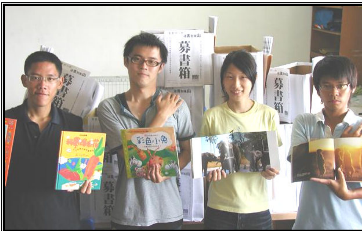
↑ 募書前置作業，貼箱子。