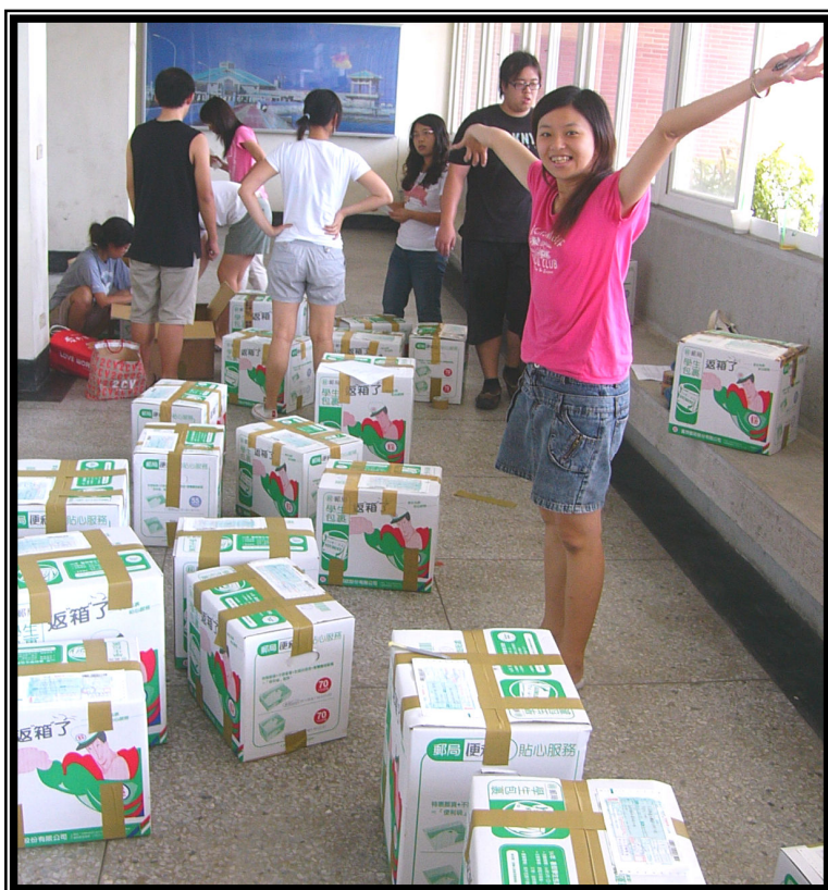
↑ 將圖書封箱後，寫上地址，等待郵差來收件。