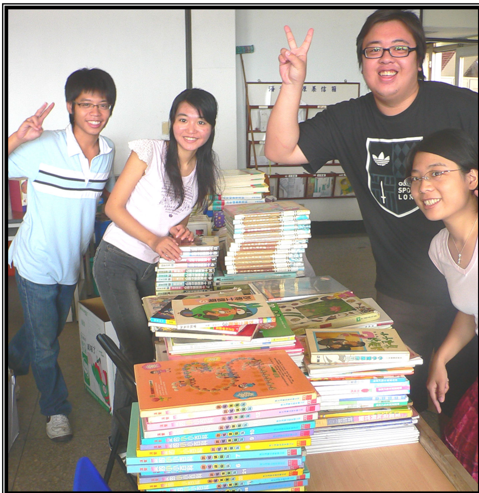
↑ 募得約兩千本兒童讀物，正在分類裝箱中。