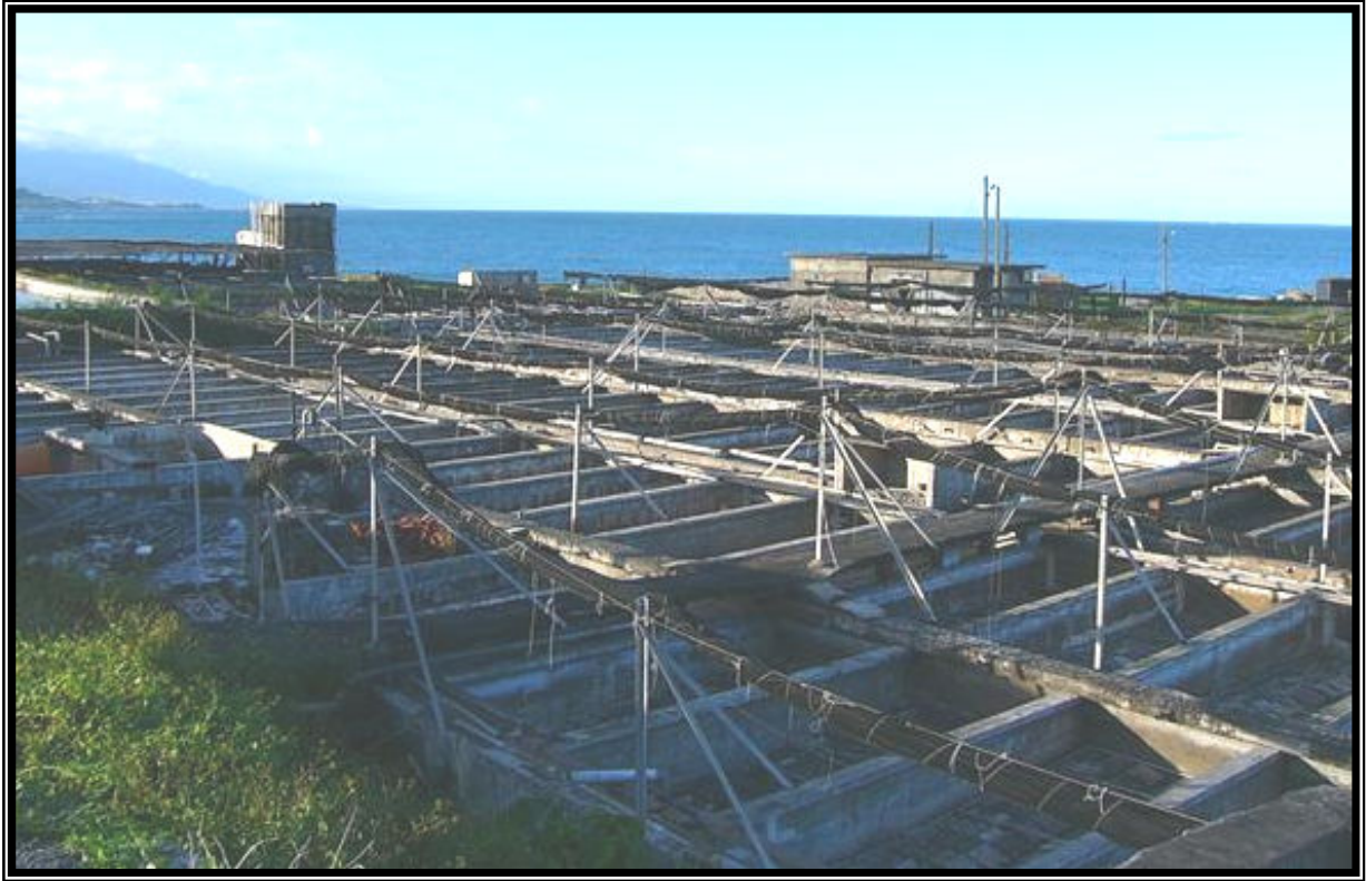
↑池底的瓦片可供九孔螺躲藏。注意喔!九孔只有一個殼 是螺不是二枚貝喔! 沿途有許多養殖場，養殖季節可能未到，池子都是乾的。