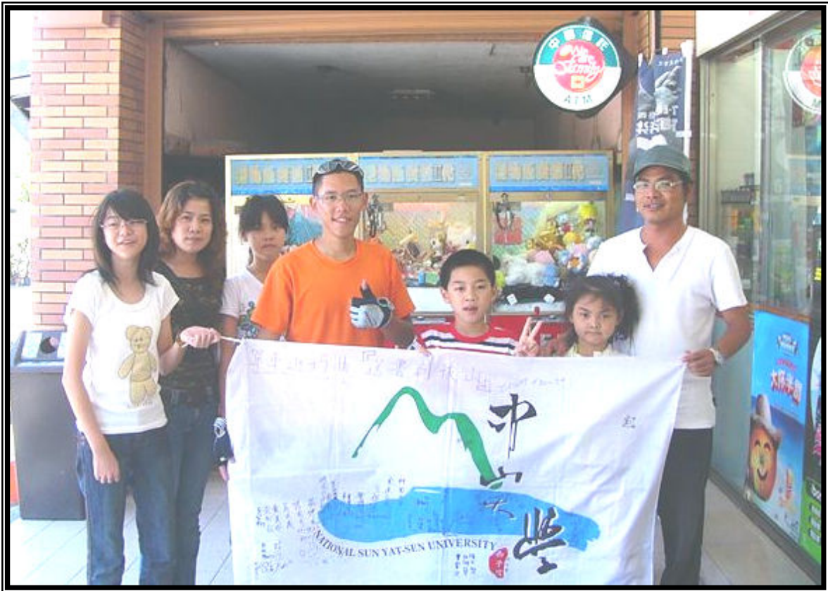
↑在豐濱鄉一家 7-11 前休息，遇到從宜蘭來的一個家庭，對我們的打扮十分好奇！ 一個個問題回答完後，請全家一起簽名合照。有一個女孩簽："愛台灣 la~"