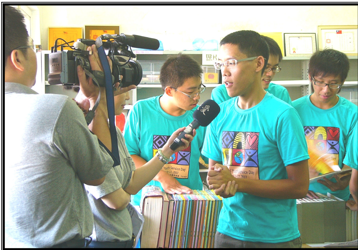
↑ 送書到後山活動公開後，接受大愛電視台採訪。