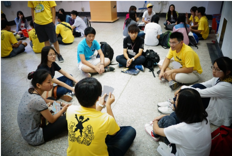
初次見面的破冰活動