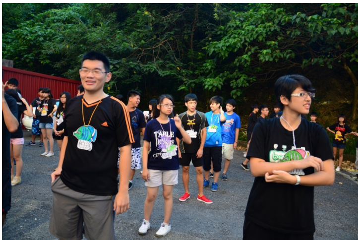
打起一天的精神—跳早操