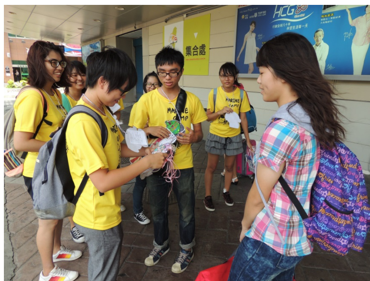
小隊輔們親切歡迎