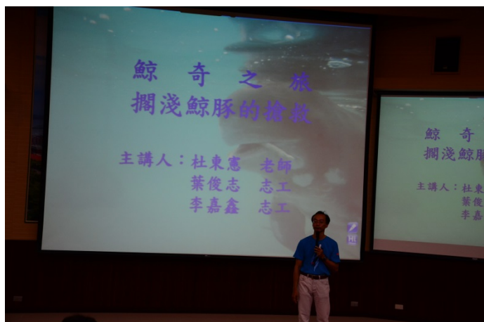
邀請外賓介紹鯨豚的知識演講