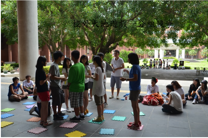
校外大地遊戲—分組競爭