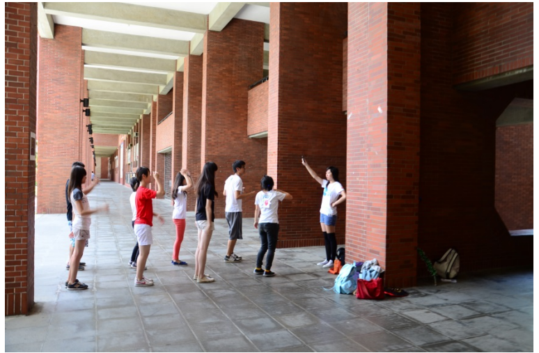
校內大型活動—跳早操