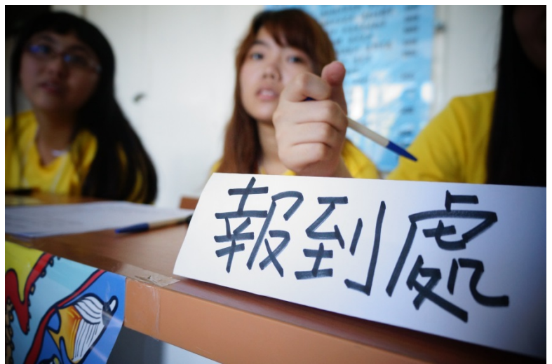
工作人員於報到處 迎接小隊員