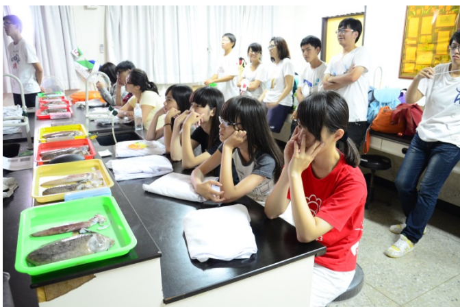
同學們認真的聽講