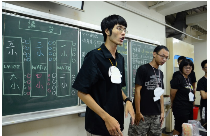
學長親自授課講解微生物