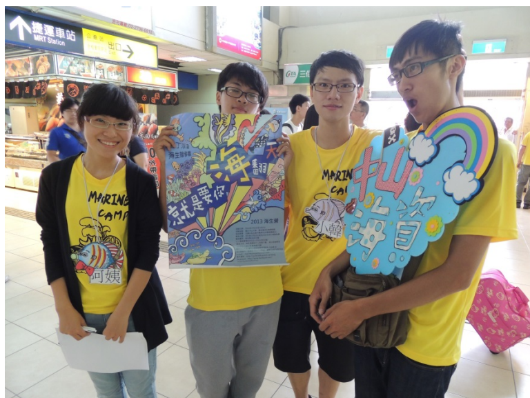
在火車站接迎接小隊員