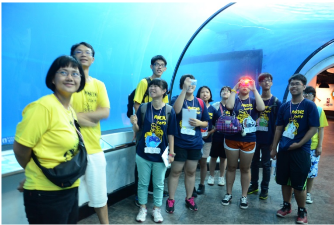
海生館展館的參觀