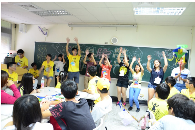
各小隊呈現絞盡腦汁的小隊呼